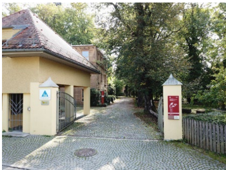
Eingang zum Bildungszentrum Burg Schwaneck