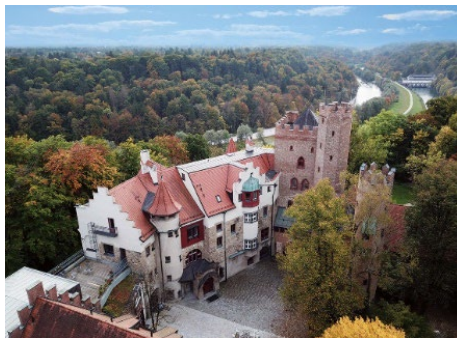
Das Bildungszentrum Burg Schwaneck von oben