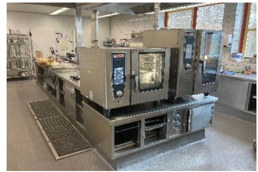
Arbeiten in einer modern ausgestatteten Küche